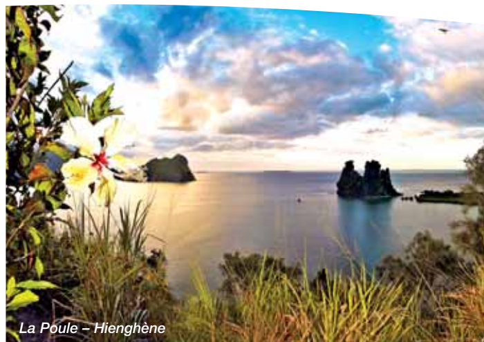
La Poule - Hienghène