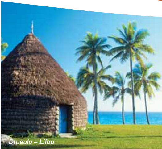
Drueulu – Lifou