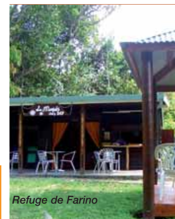
Refuge de Farino