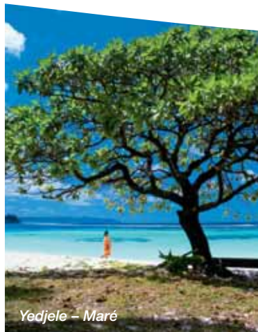
Yedjele – Maré