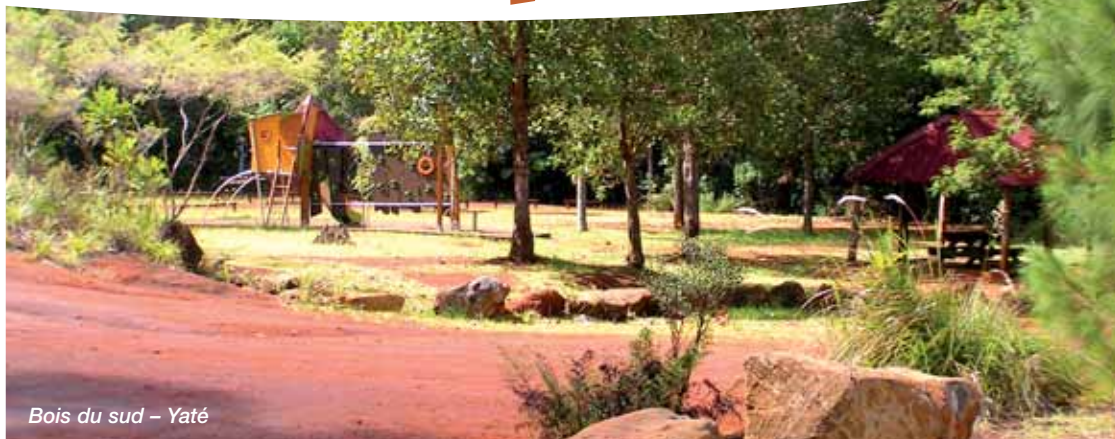
Bois du sud – Yaté