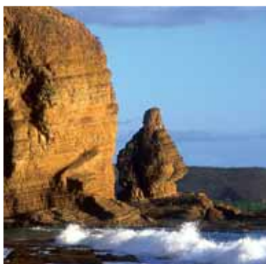
La Roche Percée - Bourail