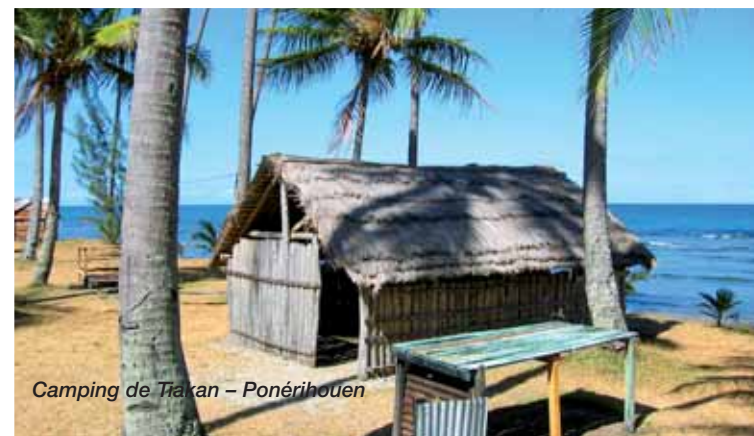
Camping de Takan – Ponérihouen