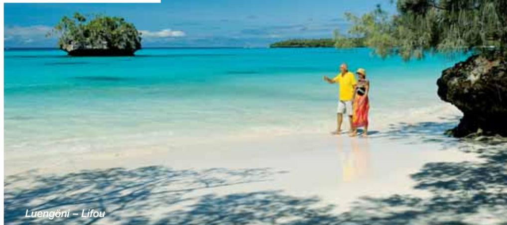
Luengöni – Lifou