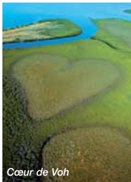
Cœur de Voh