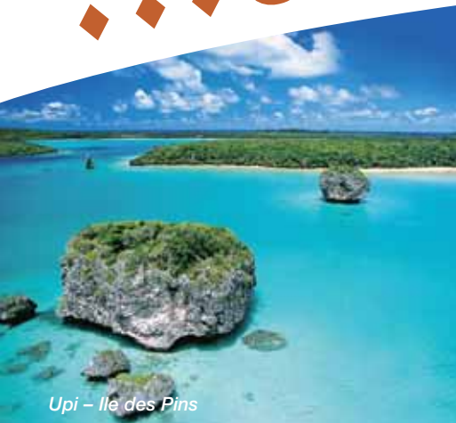
Upi - Ile des Pins